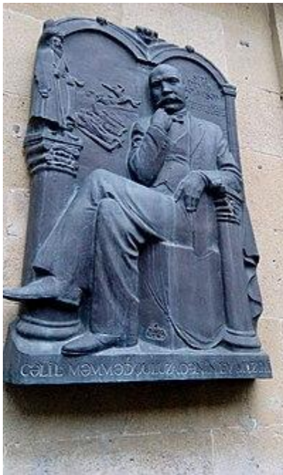
Cəlil Məmmədquluzadə ev muzeyi

1920-ci ilin iyun ayında C.Məmmədquluzadə ailəsi ilə birlikdə Təbrizə köçmüş [4] və 1921-ci ildə orada Molla Nəsrəddinin 8 nömrəsini çap etmişdir. 1922-ci ildə "Molla Nəsrəddin" in nəşrinin burada davam etdirmişdir. "Yeni yol" qəzetinin redaktoru, Ümumittifaq Mərkəzi Yeni Əlifba Komitəsinin üzvü, Bakı Tənqid-Təbliğ Teatrının təşkilatçılarından olmuş, "Maarif və mədəniyyət", "Yeni kənd", "Şərq qadını" (indiki "Azərbaycan qadını") və s. mətbuat orqanlarında fəaliyyət göstərmişdir. 20-ci illərin ikinci yarısından tibarən C. Məmmədquluzadənin həyatında