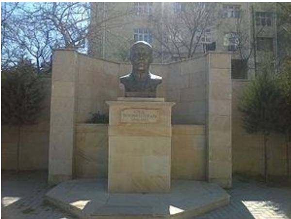
Cəlil Məmmədquluzadənin büstü