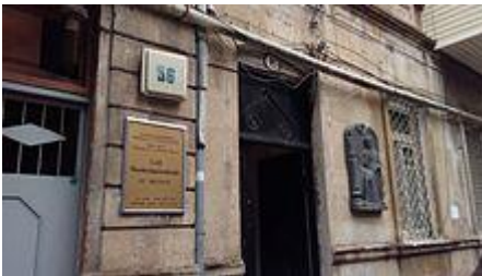
Cəlil Məmmədquluzadənin Bakıdakı Ev Muzeyi

C. Məmmədquluzadənin publisit əsərlərində milli məsələdən, İran və Türkiyə inqilablarından, qadın azadlığı, maarif, ədəbiyyat, incəsənət, ana dili və s. ictimai-mədəni tərəqqi problemlərindən bəhs edilir, qabaqcıl fikirlər yürüdüldü. Çoxcəhətli, dərin bilik sahibi olan ədib Datvin, Epikür, və Sokrat, Şekspir və Şiller, Kant və Spinoza, Holbax və Leybnits, Qlinka və Bethoven, Derjavın və Puşkin, Zərdüşt və Mani, müxtəlif siyasi, fəlsəfi, dini, sosioloji cərəyanlar haqqında yazmış, mürtəce ideyaları rədd etmiş, Bəşər dühasının mühüm nailiyyətlərini təbliğə çalışmışdır. 1922-1930-cu illərdə C. Məmmədquluzadə "Molla Nəsrəddin"i mübariz mətbua orqanlarından birinə çevirmək üçün səylə çalışmış, gənc yazıçı və rəssamların böyük bir nəslini satirik jurnalistika sahəsində işləməyə hazırlayırdı. Jurnalın bu illərdə çıxan nomrələrində C. Məmmədquluzadə satiraya yeni ictimai məzmun vermək məqsədi ilə ciddi yaradıcılıq axtarışları aparırdı. O, publisistikası, nəsr və dram əsərləri ilə Azərbaycan ədəbiyyatını janr və formaca da zənginləşdirmişdir. Xüsusilə də, kiçik hekayənin böyük ustadı hesab edilirdi. Hekayələri sosial mətləbləri son dərəcə yığcam formada, məharətlə əks etdirmək baxımından dünya ədəbiyyatının kamil nümunələri sırasında durur. C. Məmmədquluzadənin zəngin bədii irsi, "Molla Nəsrəddin" jurnalı təkcə Azərbaycanda deyil, Yaxın və Orta Şərqdə, xüsusilə İran və Türkiyədə ədəbi-ictimai fikrin, maarifçi-demokratik hərəkatın inkişafına təsir göstərmişdir.