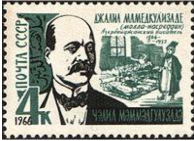
Cəlil Məmmədquluzadənin 100 illiyi münasibətilə buraxılmış