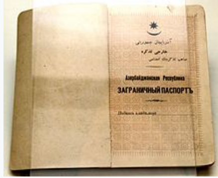
Azərbaycan Xalq Cümhuriyyətinin tərtib etdiyi xarici passport