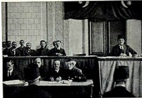
Azərbaycan Xalq Cümhuriyyəti Parlamentinin açılışı

1918-ci il 28 mayda Milli Şura Azərbaycan Xalq Cümhuriyyətinin birinci hökumət kabinəsini təşkil etməyi Milli Şuranın üzvü, bitərəf Fətəli xan Xoyskiyə tapşırırdı. Bir saatlıq fasilədən sonra yığılan Milli Şuranın iclasında Fətəli xan Xoyskinin başçılığı ilə Cümhuriyyətin ilk Hökuməti təsdiq edildi. İlk Hökumətdə vəzifələr aşağıdakı kimi bölüşdürülmüşdü: Fətəli xan Xoyski - Nazirlər Şurasının sədri və daxili işlər naziri; Xosrov bəy Sultanov - hərbi nazir; Məmməd həsən Hacinski - xarici işlər naziri; Nəsim bəy Yusifbəyli - maliyyə və xalq maarifi naziri; Xəlil bəy Xasməmmədov - ədliyyə naziri; Məmməd Yusif Cəfərov - ticarət və sənaye naziri; Əkbər ağa Şeyxülislamov - əkinçilik və əmək naziri; Xudadat bəy Məlik-Aslanov - yollar, poçt və teleqraf naziri; Camo bəy Hacinski - dövlət nəzarəti naziri. Azərbaycan Xalq Cümhuriyyəti Parlamentinin ilk təsis iclası 1918-ci il dekabr ayının 7-də Bakıda Tağıyev qız məktəbində oldu. Azərbaycan parlamentinin qanunvericilik və mərkəzi dövlət orqanlarını formalaşdırmaq, onların səlahiyyətini müəyyən etmək funksiyasından başqa bu və ya digər orqanın hesabatını dinləyib, onlar haqqında müvafiq qərar qəbul etmək, eləcə də ali dövlət nəzarətini həyata keçirmək funksiyaları var idi. Parlament iclaslarının gündəliyindən xeyli hissəsi bu məsələlərə həsr edilmiş və bu barədə xüsusi qərarlar qəbul olunmuşdu.