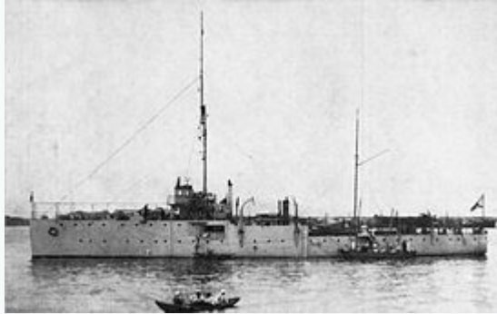
Azərbaycan Xalq Cümhuriyyəti donanmasına daxil olan Ərdəhan kanoner qayığı

Azərbaycan Xalq Cümhuriyyəti Hökuməti obyektiv çətinliklər üzündən hərbi-dəniz qüvvələrinin təşkilinə 1919-cu ilin sonlarında başladı. 1918-ci ilin sentyabrında Bakının Sentrokaspi diktaturası və ingilis müdaxiləçilərindən təmizlənməsi ərəfəsində buradakı əsas hərbi gəmiləri -"Qars", "Ərdəhan" və "Astrabad" Petrovsk-Porta aparılmışdı. 1918-ci ilin noyabrında Bakını zəbt edən ingilis hərbi qüvvələri adları çəkilən gəmiləri geri qaytarsa da, onları Azərbaycan Hökumətinə verməmiş, öz nəzarətində saxlamışdı. Cümhuriyyət Hökuməti bir neçə dəfə həmin gəmilərin Azərbaycana qaytarılması barədə vəsatət qaldırmışdı. Belə ki, xarici işlər naziri Məmməd Yusif Cəfərov 1919-cu il avqustun 4-də Bakıdakı müttəfiq qoşunlarının komandanı, ingilis generalı D.Şatelvorta müraciət edərək, paytaxtın və dəniz sərhədlərinin mühafizəsi, dövlətin ərazi bütövlüyünün qorunması üçün bir neçə hərbi gəmisinin Azərbaycana verilməsini xahiş etmişdi. Xəzərdəki hərbi-dəniz qüvvələrinin əsas hissəsi Denikin tabeliyində olsa da, silahları sökülmüş bəzi hərbi gəmiləri, o cümlədən "Qars", "Ərdəğan" və "Astrabad" 1919-cu il sentyabrın əvvəllərində Azərbaycan Hökumətinin sərəncamına keçmişdi.