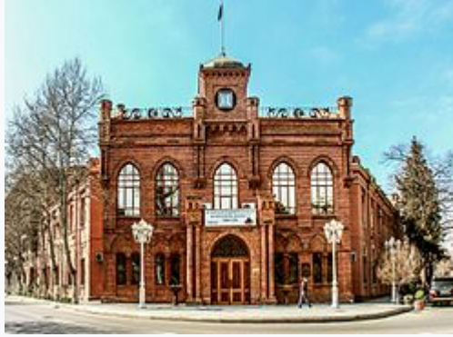
Gəncədə Xalq Cümhuriyyəti binası

Dekabrın 26-da Fətəli xan Xoyski üçüncü hökumət kabinəsinin proqramı və tərkibi barədə Parlamentdə çıxış etdi. Müzakirələrdən sonra Parlament Fətəli xan Xoyski Hökumətinə etimad göstərdi. Hökumətdə Fətəli xan Xoyski Baş nazir portfeli ilə yanaşı xarici işlər naziri vəzifəsini də tutdu. Üçüncü Hökumət kabinəsində Xəlil bəy Xasməmmədov - daxili işlər naziri; İ. Protasov - maliyyə naziri; Xudadət bəy Məlik-Aslanov - yollar naziri; Nəsim bəy Yusifbəyli - maarif və dini etiqad naziri; Aslan bəy Səfikürdski - poçt-teleqraf və əmək naziri; Səməd bəy Mehmandarov - hərbi nazir; Rüstəm xan Xoyski — himayədarlıq naziri; Yevsey Gindes - xalq səhiyyəsi naziri; Mirzə Əsədullayev - ticarət və sənaye naziri; Məmməd Həsən Hacinski - dövlət nəzarəti naziri; Konstantin Lizqar - ərzaq naziri; Xosrov bəy Sultanov - əkinçilik və dövlət əmlakı naziri; Teymur bəy Makinski - ədliyyə naziri vəzifələrini tutdular.