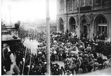
Bakını almış Qafqaz İslam Ordusunun şəhərdə fəxri keçidi

Hökumətin 24 iyun 1918-ci il tarixli qərarına əsasən, Azərbaycanın dövlət bayrağı kimi qırmızı fonda ağ aypara və səkkizguşəli ulduzun təsvir edildiyi qırmızı parçadan hazırlanmış bayraq qəbul olundu. Noyabrın 9-da bu bayraq, ağ aypara və səkkizguşəli ulduzun təsvir olduğu mavi, qırmızı və yaşıl rəngli bayraqa əvəz edildi. Azərbaycan Cümhuriyyətinin dövlət bayrağının üç rəngi "türk milli mədəniyyətini, müasir Avropa demokratiyasını və islam sivilizasiyasını təmsil edirdi".