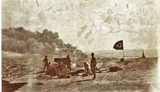
Qafqaz İslam Ordusunun əsgərləri Bakı döyüşündə

Azərbaycan Xalq Cümhuriyyəti Azərbaycan Silahlı Qüvvələrinin təşkilinə Cümhuriyyətin elan edildiyi gündən başlanmışdı. Yeni yaradılacaq ordunun əsasını Müsəlman korpusu təşkil edirdi. Ordu quruculuğuna rəhbərlik üçün ilk Hökumət kabinetinin tərkibində Hərbi Nazirlik də nəzərdə tutulmuş və Xosrov bəy Sultanov hərbi nazir təsdiq edilmişdi. Lakin bu kabinetin buraxılması ilə hərbi nazir vəzifəsi də ləğv edilmiş və Azərbaycanda ordu quruculuğu prosesinə rəhbərlik Hökumətin qərarı ilə Qafqaz İslam Ordusunun komandanı Nuru Paşaya həvalə olunmuşdu. Hökumət strukturunda isə Qafqaz İslam Ordusu komandanlığı ilə əlaqələri nizamlayacaq hərbi işlər üzrə baş müvəkkil vəzifəsi təsis olunmuş və İsmayıl xan Ziyadxanov bu vəzifəyə təsdiq edilmişdi. Azərbaycan Hökumətinin 1918-ci il 3 iyul tarixli qərarı ilə 19 yaşlı tamam olmuş vətəndaşlar hərbi çağırışın yerinə yetirilməsinə cəlb olunurdular. 1918-ci il iyunun 26-da Hökumətin qərarı ilə Müsəlman korpusu Əlahiddə Azərbaycan korpusu adlandırıldı və onun ştat cədvəlində qismən dəyişiklik edildi. General-leytenant Əliağa Şıxlinski korpusun komandiri kimi vəzifəsini yenə də davam etdirdi.